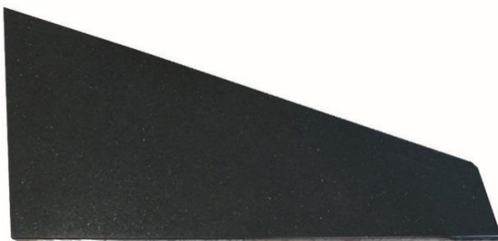
massiv 40 mm, gewendelte Stufe

Optisch ist eine massive Natursteinstufe von einer Granit-Light-Stufe nicht zu unterscheiden. Hier der Vergleich: