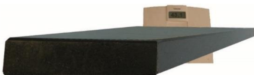
massiv 43,1 kg

Beim Gewicht wird der Unterschied deutlich. Dargestellt sind Stufengrößen 92 cm Laufbreite und 35 cm mittlere Tiefe. Jeweils 40 mm stark