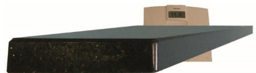
11,5 kg als Granit-Light-Stufe